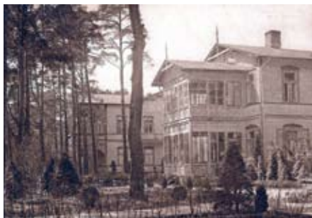
Otwock – sanatorium Górewicza