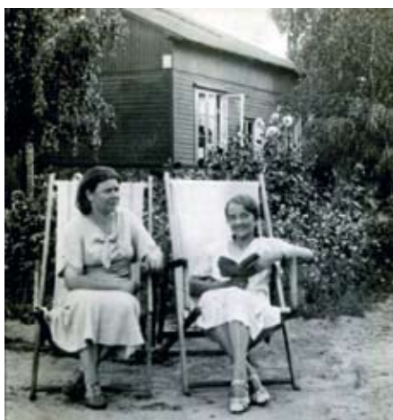
Letnisko Wesola. 1937 r.

ulgę przynosiły wyprawy nad rzekę Świder bądź nad Wisłę. Częstymi atrakcjami były zabawy i potańcówki, zatrudnienie znajdowało wiele kapel, które przybywały nawet z sąsiednich województw, a Falenica i Otwock posiadała sale kinowe. Reszta zadowalała się tymi objazdowymi. Letnie wieczory upływały na spotkaniach towarzyskich i ogniskach. Dużym