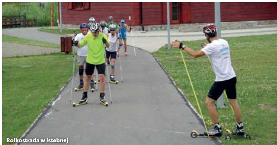
Rolkostrada w Istebnej

która podobnie jak narciarstwo biegowe charakteryzuje się dużymi walorami prozdrowotnymi (odciąża stawy, kształtuje równowagę, kondycję i koordynację). Osoby początkujące lub mniej wprawione w poruszaniu się na nartorolkach, rolkach lub wrotkach muszą łamać prawo na ścieżkach rowerowych!