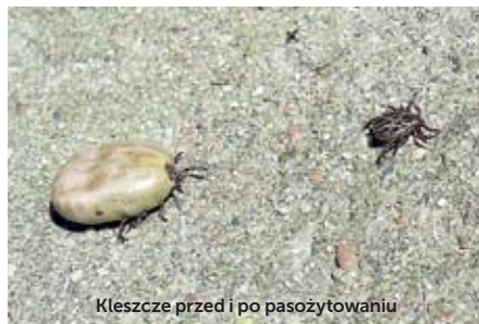
Kleszcze przed i po pasożytowaniu

To przynajmniej może zrobić każdy kto sąsiaduje z lasem, niezabudowaną i zaniedbaną działką bądź innym siedliskiem gryzoni.