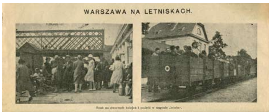
Gazeta Warszawska nr 209 z 1926 r.