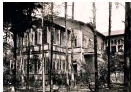
Otwock – Sanatorium dr Przygody 1926 r. Styl Nadświdrzański (ze zb. NAC)

Okres po zakończeniu I wojny światowej to początek największego rozkwitu podwarszawskich terenów wypoczynkowych, a lata 20 i 30-te XX wieku to apogeum ich funkcjonowania, kiedy to w sezonie zjeżdżało się kilkadziesiąt tysięcy osób. Wtedy też zaprzestano używać potocznego określenia wilegiatura (z jęz. włos., villeggiatura – letnisko) na rzecz rodzimych „wywczasów” i właśnie letnisk.