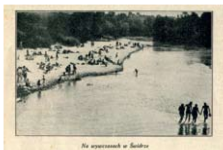
Tygodnik Ilustrowany nr 29 z 1929 r. Plaża nad Świdrem