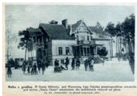
Ilustrowany Kurjer Codzienny nr 65 z 1927 r. (ze zb. autora)