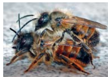
Murarki: na wychodzącą z kokonu samice zwykle czeka już gotowy do godów samiec

Ale to jeszcze nie koniec niespodzianek bo z kolejną klasą trochę zabłądziliśmy. Niechcący skręciliśmy w uliczkę Za Dębami a ponieważ brakowało już czasu to właśnie tam, pszczołkę samice murarki, która dopiero co wyszła z kokonu wypuściliśmy ze szklanego