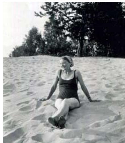
Na letniku w Starej Miłosni. 1939 r.

Początek XX wieku to okres kiedy budownictwo letniskowe rozprzestrzeniło się na pozostałe znane dziś miejscowości. Duży wpływ miał na to carski ukaz pozwalający na wzniesienie budynków w pobliżu dawnych fortów i terenów wojskowych. Od 1910 roku zaczął rozbudowywać się Wawer i budować Anin. Wraz z otwarciem linii kolei konnej z Wawra do Starej Miłosny w roku 1908 zaczęto budować i przyjmować gości w Kaczym Dole (dziś Międzyzylesie), Pokaczym Dole (dziś Wiśniowa Góra)