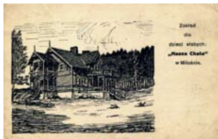
Sanatorium „Nasza Chata” w Starej Miłosni. Lata 20-te (ze zb. autora)

Letniska objęły również tereny Wesołej i Wiązowny. O ile Wiązowna nie miała niewątpliwego atutu, jakim jest bliskość bądź potężenie z dużą linią kolejową i musiała sobie radzić w inny sposób to Wesoła powstała i mogła rozwijać się jako letnisko dzięki funkcjonującej od 1866 roku Kolei Terespolskiej. Obszar wczasowy obejmował teren od stacji kolejowej do okolic dzisiejszego Urzędu Dzielnicy, gdzie miała kres ówczesna ulica Kolejowa (dziś 1 Praskiego Pułku, nie było znanego obecnie potężenie ze Starą Miłosną) oraz Wolę Grzybowską. W większym stopniu niż w pasie otwockim budowano tam budynki murowane, stąd wiele z nich przetrwało do dziś.