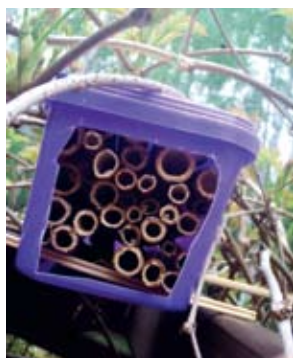
Gniazdko w pudełku po lodach

Największą atrakcją okazały jednak, pochodzące z hodowli, kokony pszczół murarek z których owady przy nas wygryzały się i odlatywały w świat. Dzieci dowiedziały się również, że nie trzeba być krezusem żeby zbudować hotel dla dzikich pszczół. Wystar-