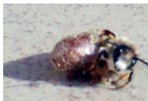
Murarka wychodzi z kokonu