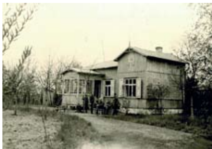
Świdermajer w Wesolej. Lata 40-te